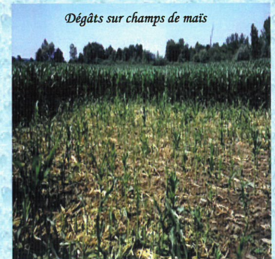
Dégâts sur champs de maïs

ATTENTION ! Pour lutter contre le ragondin et le rat musqué Ils doivent être classés nuisibles par arrêté préfectoral avant destruction