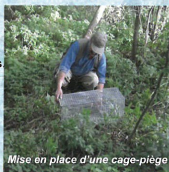
Mise en place d'une cage-piège

Ne pas le relâcher, contacter l'Office National de la Chasse